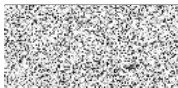
oprávněná úřední osoba