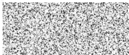
oprávněná úřední osoba

Za vydané rozhodnutí nebyl dle ustanovení § 8 zákona č. 634/2004 Sb., o správních poplatcích, ve znění pozdějších předpisů, vyměřen správní poplatek.