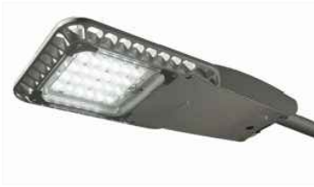
vyobrazení navrženého svítidla